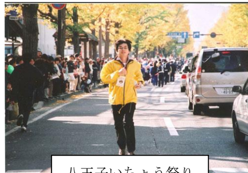
八王子いちよう祭り