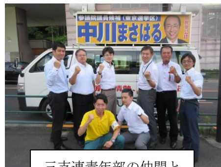
三支連青年部の仲間と