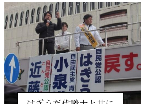
はぎうだ代議士と共に