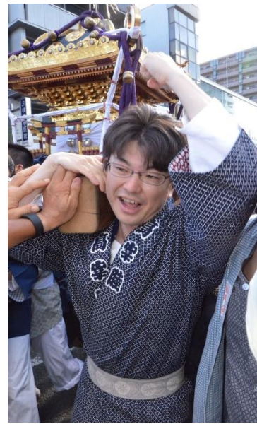
八王子まつり 千貫神輿渡御

先輩たちが築き上げられた故郷の「絆」を受け継ぎ、 礼儀、あいさつを通じて心身共に健康な「体」を育み、 次世代の子どもたちへ「心」を繋げます。