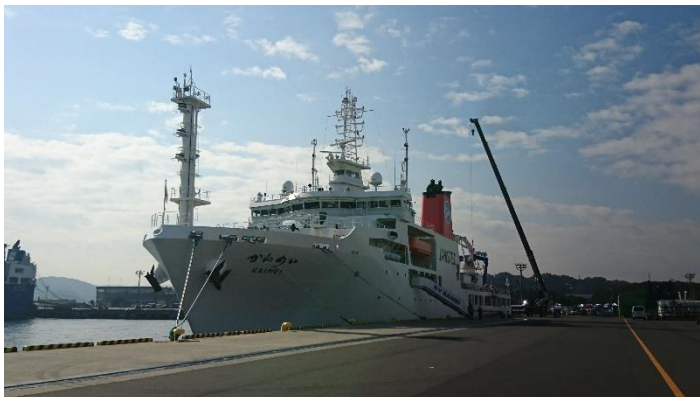
自民党八王子総支部が主催する視察研修会に参加。海洋調査機構として活動している JAMSTEC の見学を始め、今後の海洋開発について研鑽を積む。(写真は、調査船「かいめい」、「しんかい6500」)