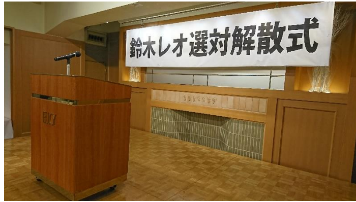
都議選を戦った選挙対策本部の開催式を開催。多くの皆様の支えに、心より感謝申し上げます。