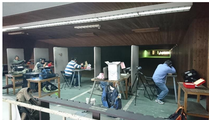
会長を務める、八王子市民大会のライフル射撃連盟大会を開催。(埼玉県長瀬射撃場にて)