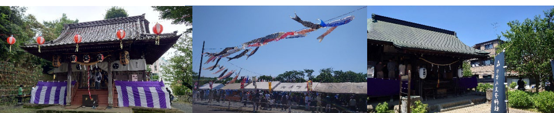
地域行事が戻りつつ ある中、各行事へ 参加

【後援会行事についてのお知らせ】 毎年、夏に行っております後援会流しそうめん・BBQ につきまして、本年は中止と致します。 なお、ゴルフ大会は、9月20日(水)、年末旅行会は12月末に予定しております。