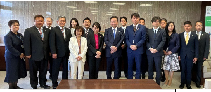
新たに結成した、自民党新政会 13 名