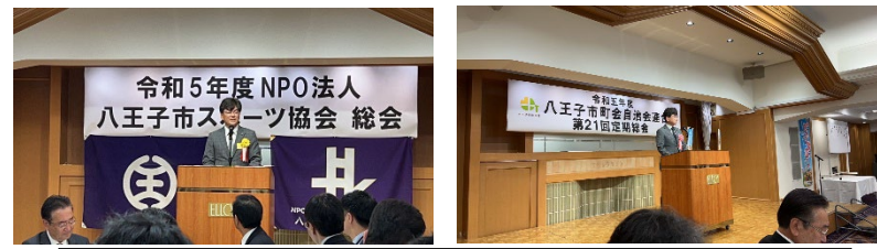
議長として、議会を代表してのご挨拶